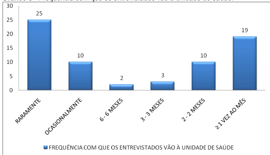
Gráfico 3 - Frequência com que os entrevistados vão à unidade de saúde.

O Gráfico 3 diz respeito à frequência com que esse usuário busca o atendimento na Unidade. A partir da análise dos dados gráficos, observa-se que a maioria dos entrevistados procuram raramente os serviços de saúde.